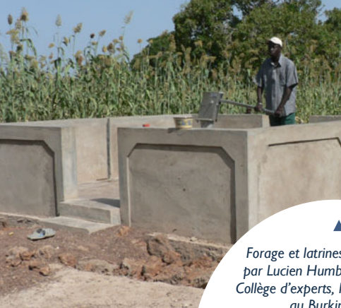
▲ Forage et latrines photographiés par Lucien Humbert, membre du Collège d'experts, lors de sa mission au Burkina Faso.