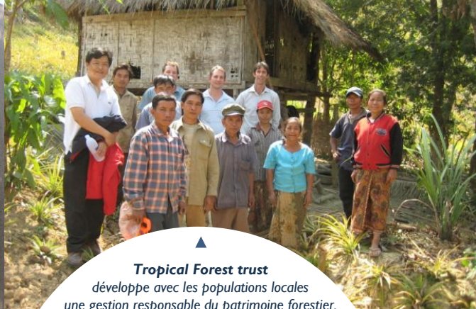
▲ Tropical Forest trust développe avec les populations locales une gestion responsable du patrimoine forestier.