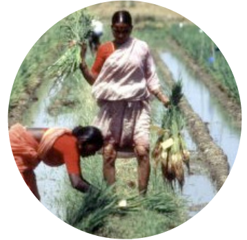
Inde: transplantation de riz par des femmes dans un champ expérimental

Michel Jarraud, (secrétaire général de l'OMM)