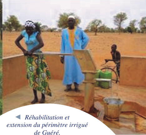
◀ Réhabilitation et extension du périmètre irrigué de Guéré.

SAHEL SOLIDARITE / WATER AID Burkina Faso