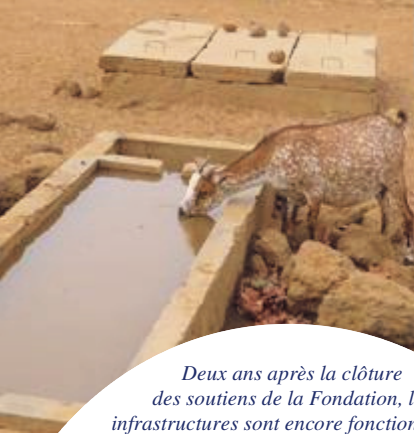
Deux ans après la clôture des soutiens de la Fondation, les infrastructures sont encore fonctionnelles.